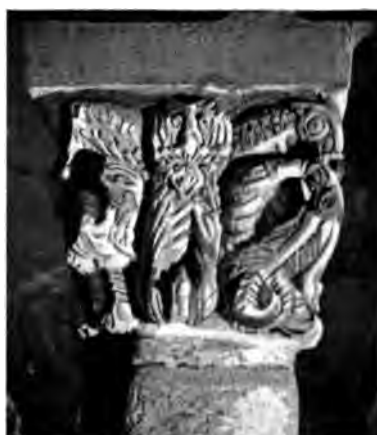
Chapiteaux de la crypte de Saint-Bénigne.

sures, par les anges, les martyrs, les vieillards de l'Apocalypse, des animaux, des oiseaux et des fleurs ; au linteau, la Vierge trône avec l'enfant, et, au tympan, le Christ bénissant s'entoure des emblèmes des évangélistes, des chérubins, des images de l'ancienne et de la nouvelle Loi.